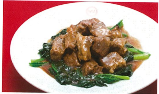
牛バラ肉の煮込み