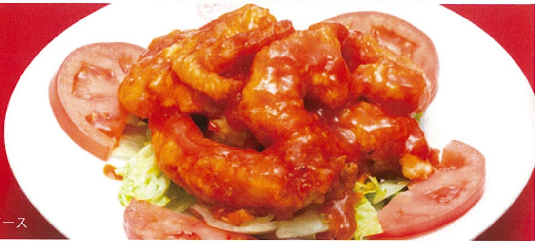
エビのチリソース