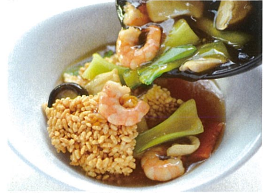
もち米フライの海鮮あんかけ