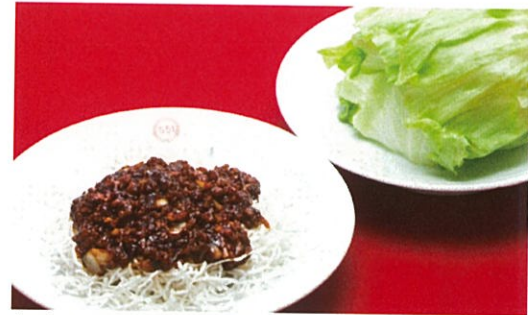
豚肉と玉葱の甘味噌炒め～レタス包み～