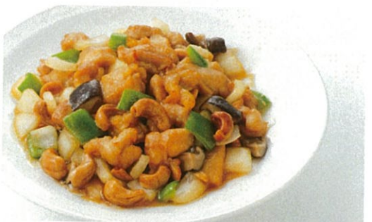
鶏肉と野菜、カシューナッツのオイスターソース炒め