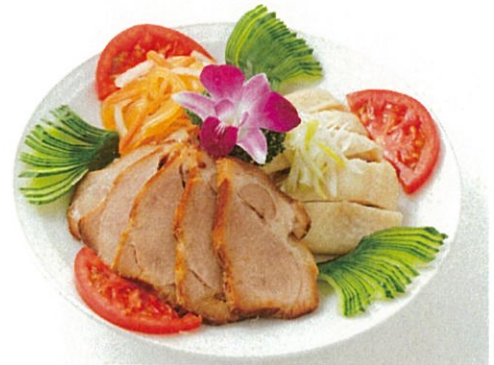
三種冷菜盛り合せ