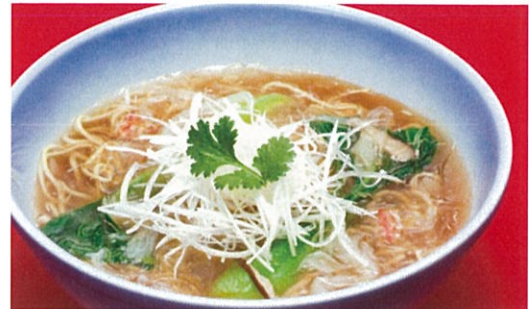
カニフカヒレラーメン