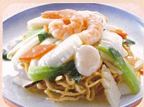
海鮮揚げそば スープ付