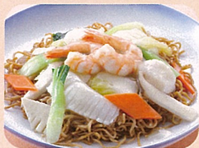
海鮮焼そば スープ付