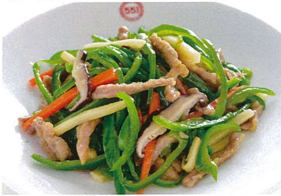
チンジャオロースー 青椒肉絲 1,050円