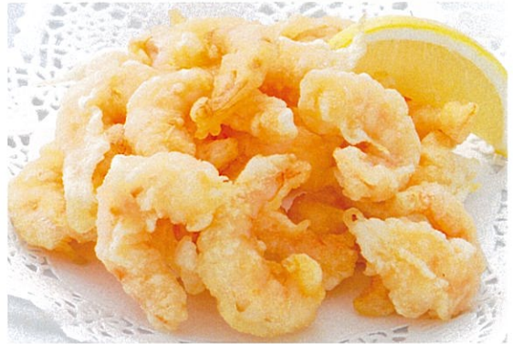
小エビの天ぷら 950円