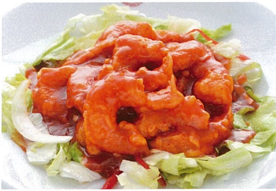
エビのチリソース 1,050円