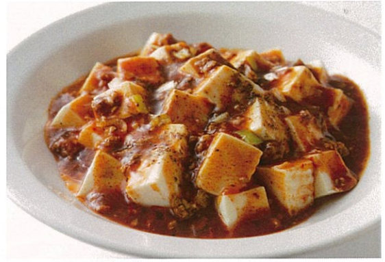
マーボ 麻婆豆腐 1,050円