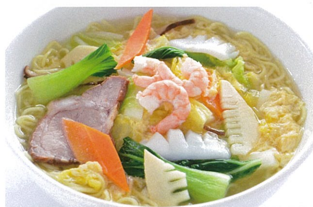
ゴモクタンメン 五目湯麺 1,070円