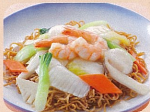
海鮮焼そば スープ付