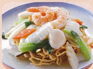
海鮮揚げそば スープ付