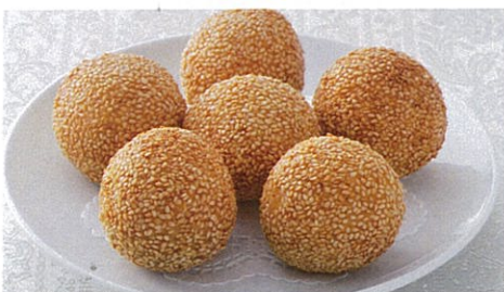
胡麻付き揚げ団子 【6コ入】 2,100円