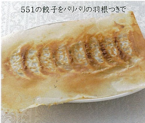
焼餃子 【8個】 500円