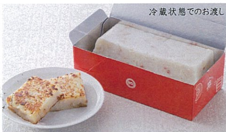
大根餅 【1本】 1,800円