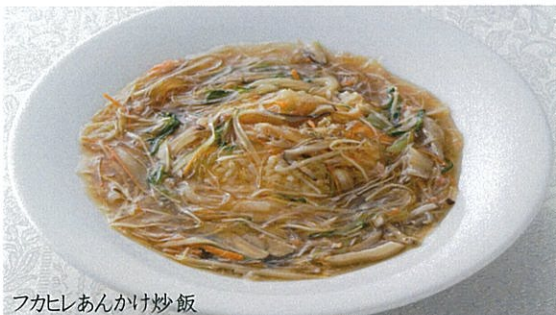
フカヒレあんかけ炒飯