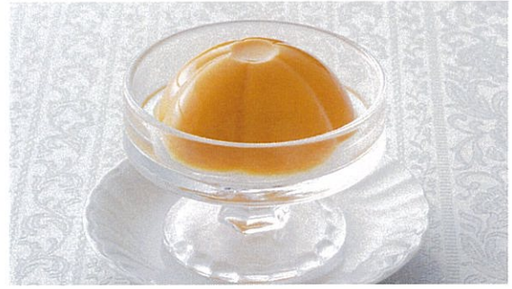
マンゴープリン 500円