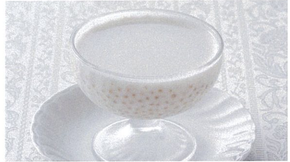
タピオカ入りココナッツミルク 500円