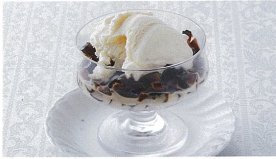
コーヒーゼリー 500円