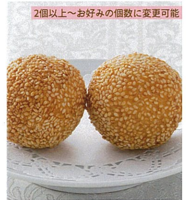
胡麻付き揚げ団子 【2個】 700円