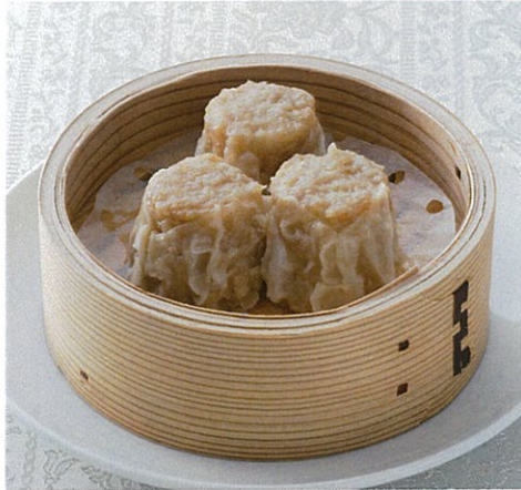
551焼売 【3個】 450円