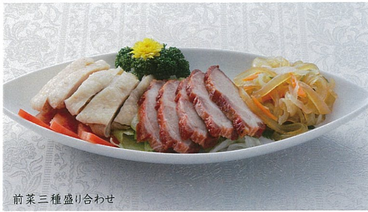
前菜三種盛り合わせ