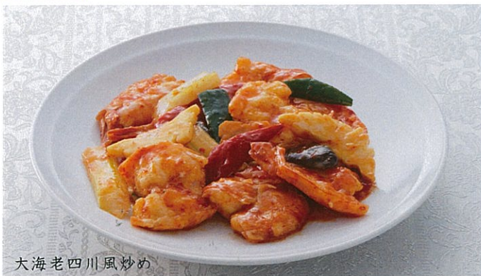
大海老四川風炒め

大海老 しせんふう 四川風炒め 1,800円 大海老のチリソース炒め 2,100円 大海老のマヨチリソース炒め 2,100円 エビのチリソース炒め 1,500円 小エビの天ぷら 1,300円 酢豚 1,600円