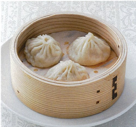
ショウロンポウ 小籠包 【3個】 600円