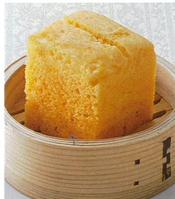
台湾マーラーカオ 600円