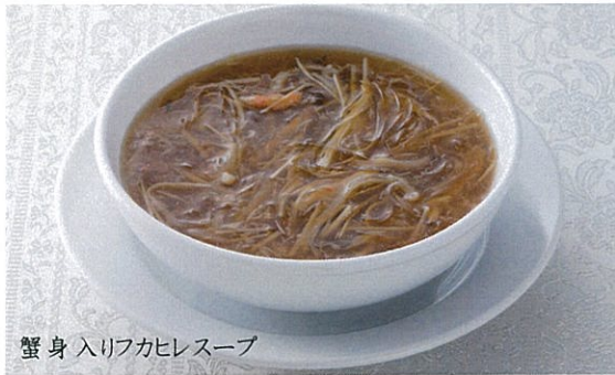
蟹身入りフカヒレスープ