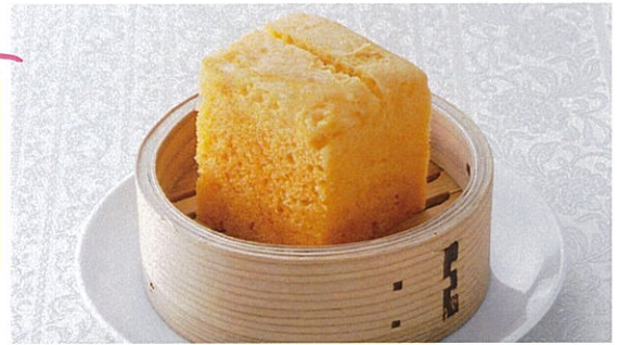
台湾マーラーカオ 600円