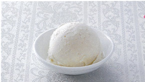
バニラアイスクリーム 380円